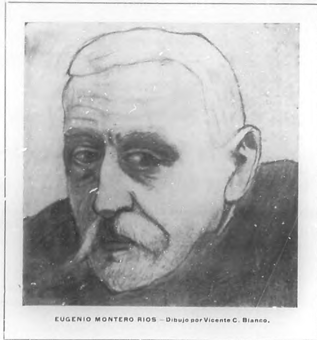
EUGENIO MONTERO RÍOS — Dibujo por Vicente C. Blanco.

Tal vez este procedimiento no fuese el fuerte de don Eugenio Montero Ríos. En política sobre todo, una cosa es la teoría y otra la práctica; las ideas puras, magnificas en las alturas de la filosofía, no alcanzan a interesar ni conmover la pública opinión; se asemejan al contraste de un ensucio delicioso con las crudezas y prosaismos de la realidad. La conchabanza es la que en estas lides trae aparejados los más seguros éxitos. Sin adaptar los procedimientos a la idiosincrasia del pueblo y al medio ambiente en todas sus fluctuaciones