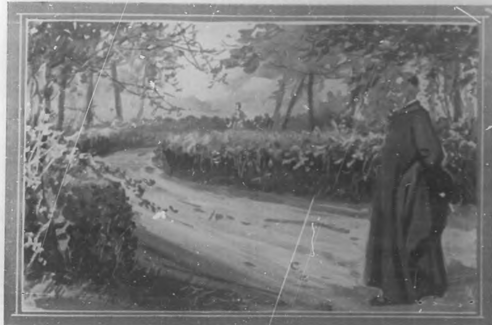
Quando el cura párroco de Miraflores reconoció, a lo lejos, a la persona que avanzaba por la alameda en dirección contraria a la que él seguía, de manera que habrían de cruzarse, forzosamente, dentro de algunos instantes, se quedó inmóvil, mitad sorprendido, mitad sobrecogido, y...

—Con mucho gusto, señor cura. Y si le parece usted, le cantaré en voz baja mi plegaria favorita, el Ave María de Gounod.