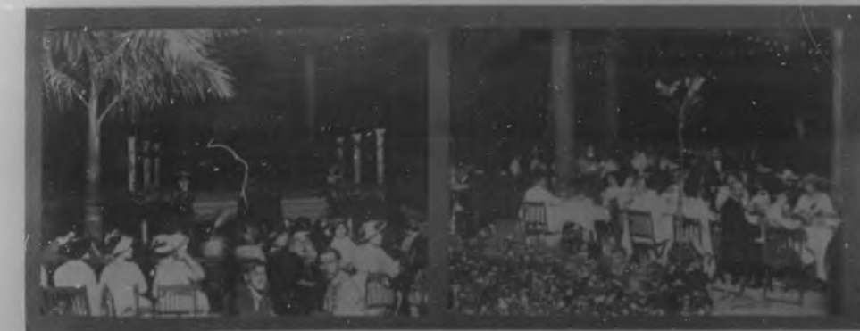
POR LA INFANCIA DESVALIDA. — Dos aspectos nocturnos del festival organizado por distinguidas damas de nuestra Sociedad, en honor de la niñez desvalida, en la preciosa Quinta de los Melinos el sábado de la semana antepasada. Las fotografías representan el escenario al "aire libre" y concurrencia a la función que en él se desarrolló y varias mesas colmadas de visitantes.

gias y capitales fuertes e importantes. Ha corrido en Cuba este elemento poderoso de acción, calificado, con justicia, de cuarto poder, la impulsión impresa en los grandes centros donde el periodismo se nutre del vértigo de la vida complicada, que aprisiona todos los latidos, todos los